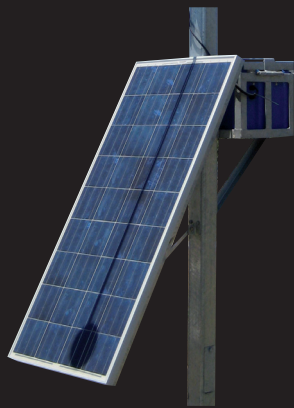
Configuración de panel solar/batería AV09-4WL luz de manga de viento

La AV-09-4WL puede instalarse inmediatamente y no requiere ningún tipo de cableado. El completo kit viene en un pallet de 155x69x76 cm para un fácil transporte. Otras configuraciones disponibles bajo petición.